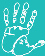
Illustration : Teo Manisier Mise en page : ADEA formations